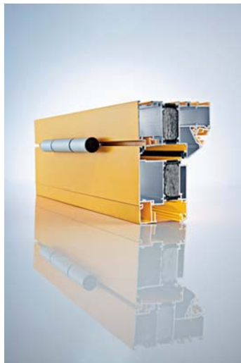
Profil der innovativen Haustüren- Serie HT72+ Dateiname: FD_Litho_29909_ Design_Haustuer_002.jpg