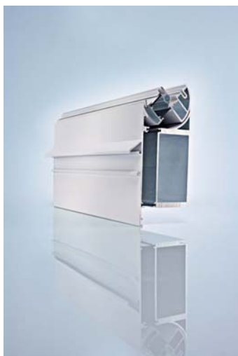
Wintergartenserie wigaTREND 860 Dateiname: FD_Litho_29909 Wintergarten_001.jpg