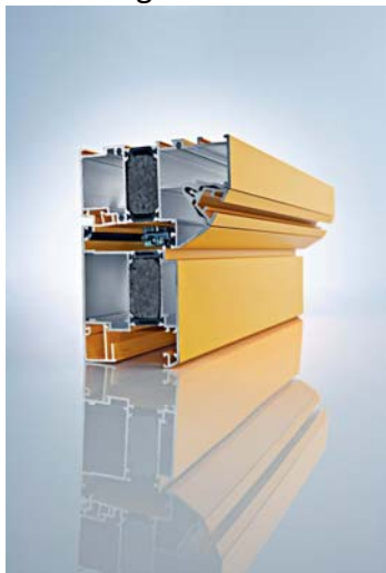
Profil der innovativen Haustüren- Serie HT72+ DESIGN Dateiname: FD_Litho_29909_ Design_Haustuer_001.jpg